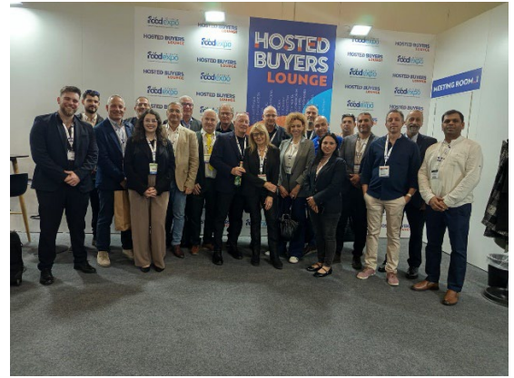
חברי משלחת לשכת ישראל יוון וחברי משלחת מטעם איגוד לשכות המסחר בתצלום משותף ביחד עם שגריר ישראל ביוון, נעם כץ.